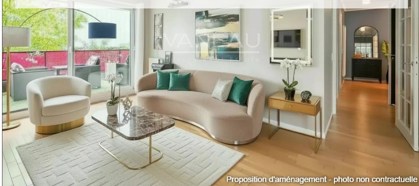
Proposition d'aménagement - photo non contractuelle